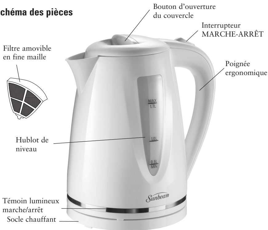
Schéma des pièces